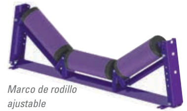
Marco de rodillo ajustable