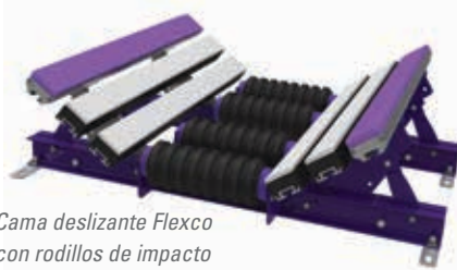
Cama deslizante Flexco con rodillos de impacto CoreTech™ (EZSB-I)