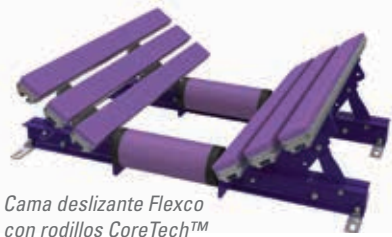
Cama deslizante Flexco con rodillos CoreTech™ (EZSB-C)