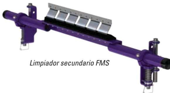
Limpiador secundario FMS